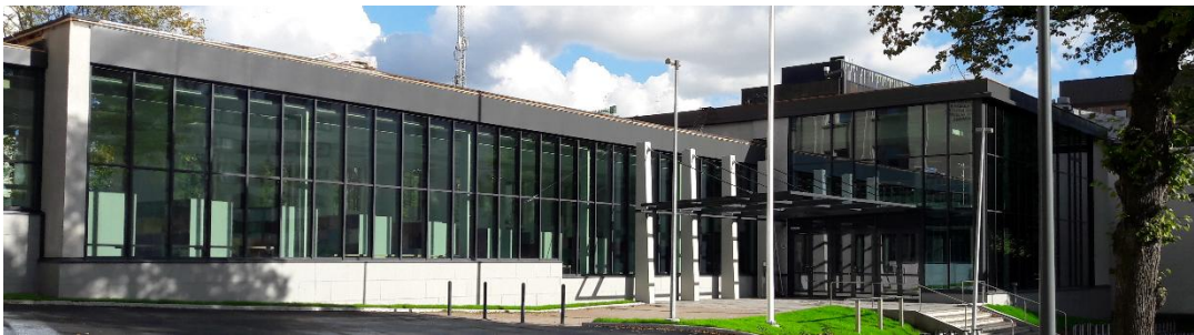
Kuva 2. Vuonna 2016 valmistunut Klassillisen lukion laajennos, jonka on suunnitellut rakennusarkkitehti Hannu Silvennoinen.

Poikkeuksen rakennetuissa kohteissa muodostaa Klassillisen lukion laajennus, joka ei täytä lähes nollaenergiarakentamisen vaatimustasoa. Rakennuksessa on noudatettu samaa rakentamistapaa kuin muissakin Tilakeskuksen uudisrakennuksissa. Selitys rakennuksen korkealle E-luvulle löytyy geometriasta ja arkkitehtuurista. Rakennus on palviljonkimainen yhdyskäytävä, jossa on runsaasti ulkovaippaa suhteessa lattiapinta-alaan. Myös julkisivulasin määrä on kaupunkikuvallisista syistä poikkeuksellisen suuri suhteessa rakennuksen laajuuteen (kuva 2).