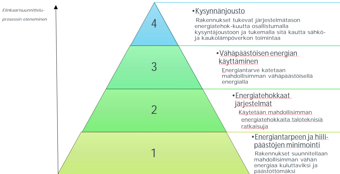
KUVA 1: ELINKAARI SUUNNITTELUOHJEEN MUKAINEN TOIMENPITEIDEN TOTEUTUSJÄRJESTYS

Rakennus on kokonaisuus, jonka elinkaarisuunnittelun ratkaisut tulee aina optimoida energiatehokkuus, elinkaarikustannukset ja hiilivaikutukset huomioiden loppukäyttäjää palvelevana kokonaisuutena. Kaikissa rakennushankkeissa noudatetaan periaatteita, jotka on havainnollistettu kuvassa 1.